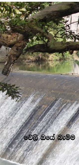
වේලි ඔයේ බැම්ම

අධික වෂ සහිත ක්ලෝරොතලොනිල්, 2 4 ඩී, බෙන්සුලිඩී, ඩැක්තල් (ඩීසීපී) ආදී රසානික දූව්‍ය රාශියක් ගොල්ලේ පිටි වල යොදන අතර මේවා නිසා පිලිකා සමේ රෝග ඇතුලු රෝග රාශියක් ඇතිවේ.